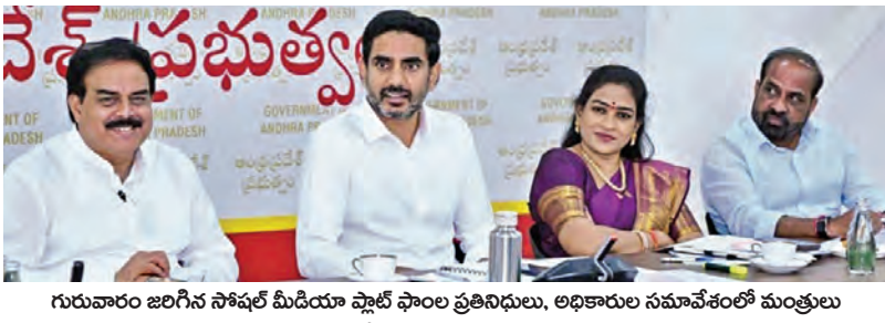
గురువారం జరిగిన సోషల్ మీడియా ఫైట్ ఫౌండేషన్ ప్రతినిధులు, అధికారుల సమావేశంలో మంత్రులు నాదెండ్ల, లోకేశ్, అనిత, సత్యకుమార్ యాదవ్